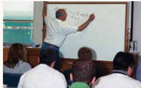
Nosotros suministramos entrenamiento en nuestra sede principal y alrededor del país

industria de las cañerías para efluentes, nosotros podemos ofrecer inigualable asistencia técnica. Cuando usted selecciona un sistema Orenco, Usted tendrá al líder de la industria detrás de usted.